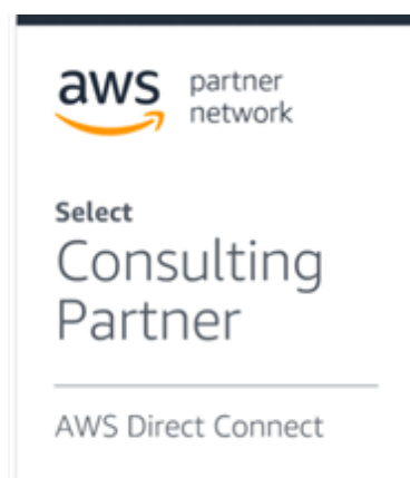
「AWS Direct Connect サービスデリバリープログラム」 認定バッジ

この度、アイテック阪急阪神が提供する「i-TEC クラウドコネクト」は、高品質で高速、かつセキュアに、AWS との接続を実現します。加えて、東京と大阪2拠点からの専用接続と、アイテック阪急阪神が保有するフル冗長化構成のネットワークにより、障害に強い接続が可能となります。