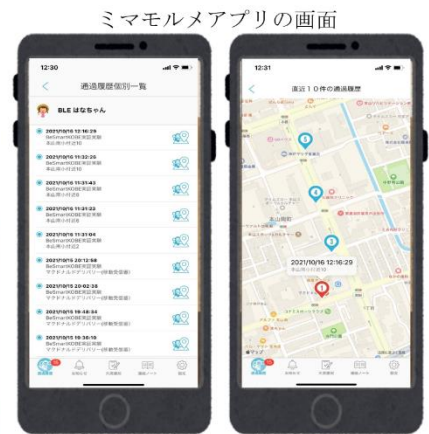
ミマモルメアプリの画面

直近10件の履歴が通過順に地図上(※)でマッピング表示されます。 ※端末によりApple Maps又はGoogle Maps(上記画像はApple Mapsの例)