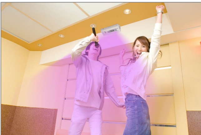
飲食・カラオケ店