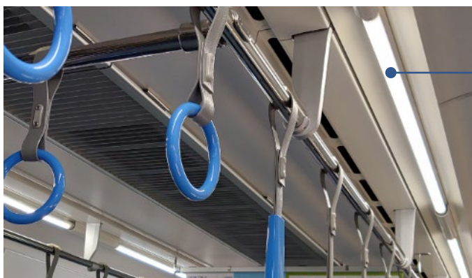
営業電車で運用中の aiSave-S

※5 aiSave-S 搭載／非搭載とも、ライトの点灯開始から7時間後に夜間の営業終了時間帯を模擬して一旦消灯しております。その後、消灯から8時間後に再点灯し、再点灯から5時間が経過 (検証開始から20時間経過) した時点で測定しており、累計のライト点灯時間は12時間です。(12時間を超えるライト点灯後の効果は、今後、検証を実施予定です。)