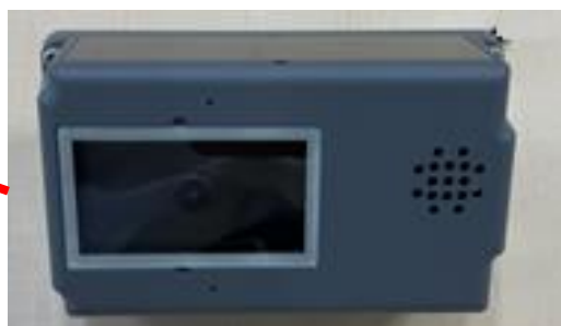
防犯カメラ設置イメージ