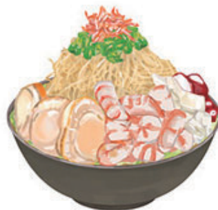
もんじゃ焼き （月島駅）