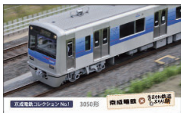
コンプリート特典カード

※限定アイテムを全て集めた方には専用応募フォームが表示され、プレゼントにエントリーすることができます。