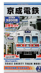
B トレインショーティー 京成電鉄 3200 形