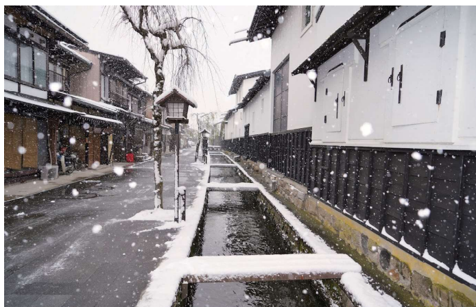
冬の瀬戸川の街並み

そのため、とても混雑する日もあれば、人数が少なく空いている日もあるというムラのある受診状況でした。特に混雑時の現場は混乱しやすく、ミスが起こりやすい状況にもなり、 検診機関からも、予約制度の導入要請がありました。