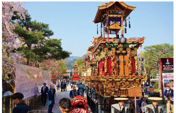
毎年 4 月 19 日・20 日に行われる古川祭の様子

小洞様 飛騨市は、気候や地勢も相まって塩蔵文化がある地域です。そのため、以前から高血圧の方が多く、脳血管疾患が多いの